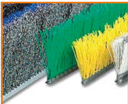
Kit ricambi ciuffi