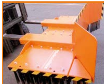
Lamiera frontale di spinta