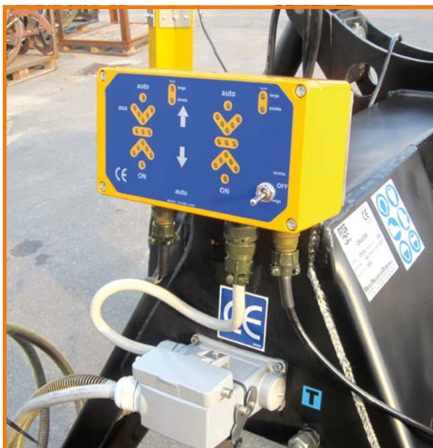
Sistema di controllo laser (1)