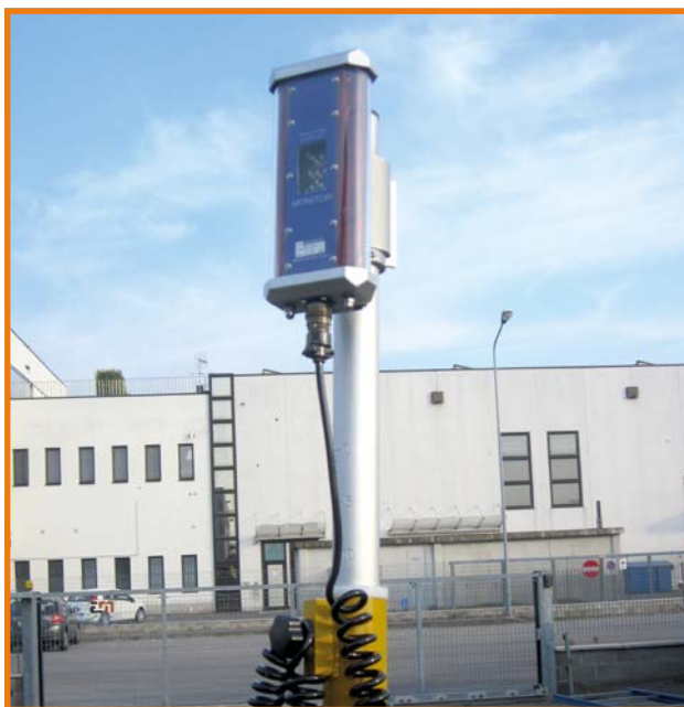
Sistema di controllo laser (1)

La Lama Grader M3 applicata alle minipale compatte con potenze da 50 a 120 HP è ideale per la preparazione e il livellamento di terreni, strade e piazzali. Viene fornita completa di sistema di inclinazione 32°, oscillazione 40° e traslazione 450 mm della lama ad azionamento idraulico tramite pulsantiera, regolatore di flusso manuale su distributore on/off, struttura in acciaio ST52, attacco di adattamento alla macchina, tubazioni idrauliche e kit comando elettrico.