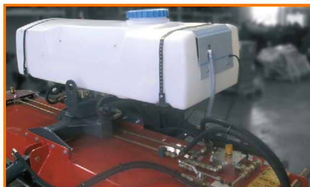
Kit innaffiante a pressione (2)