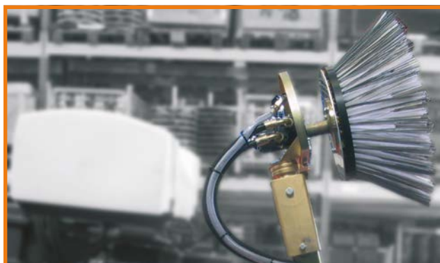
Spazzola laterale (1)